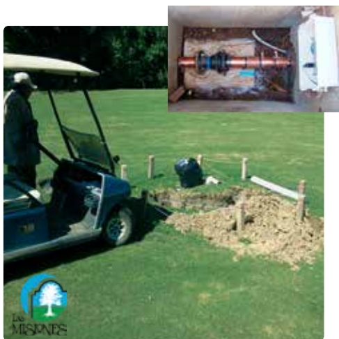
Instalación subterránea de Vulcan en el campo de golf Las Misiones