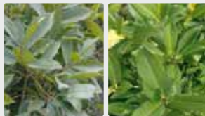
Plantas y jardines