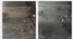
Placa de la parrilla