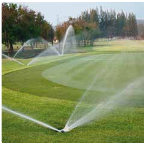
Sistema de aspersores en un campo de golf