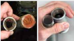
Sistema de tuberías